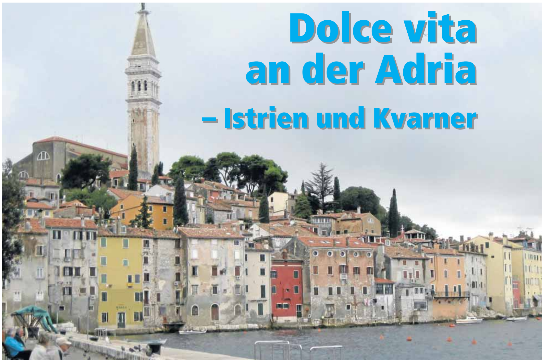
Venedig lässt grüßen: Der Blick auf die Altstadt von Rovinj. Über allem thront die Kirche der Heiligen Euphemia.