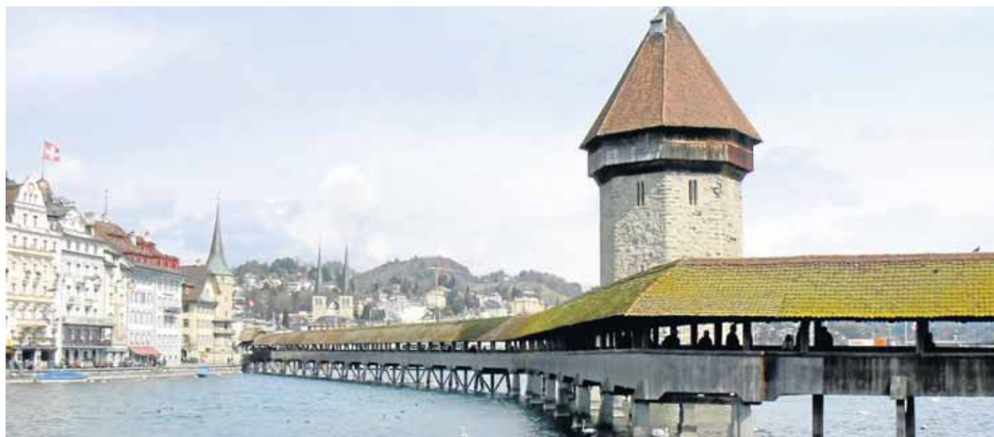
Abgebrannt und wieder aufgebaut: Die Kapellbrücke mit Wasserturm ist Luzerns Wahrzeichen.

Mein Luzern Weitblick, Gastronomie, Pisten