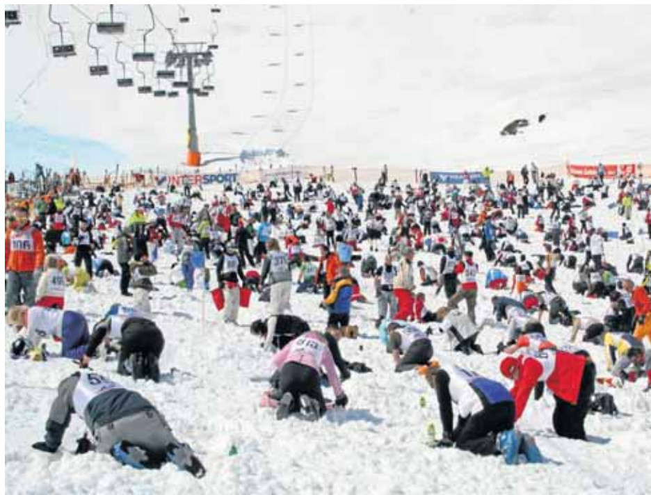
Die Schatzsuche im Schnee ist für die Urlauber in Obertauern ein wahres Pisten-Spektakel. Wer keinen Porsche ausgräbt, kann sich im Schnee vergnügen.

Es ist erst das vierte Pisten-Spektakel, aber Österreichs größte Schatzsuche hat trotzdem schon feste Rituale. Am Freitag ist Partytime. Dann heizt im Ort eine Liveband ein, dann vergeben die Organisatoren Tickets und die Startnummern. Nicht alle dürfen mitfeiern. Im Schutz der Dunkelheit wird sich wie in jedem Jahr Notar Dr.