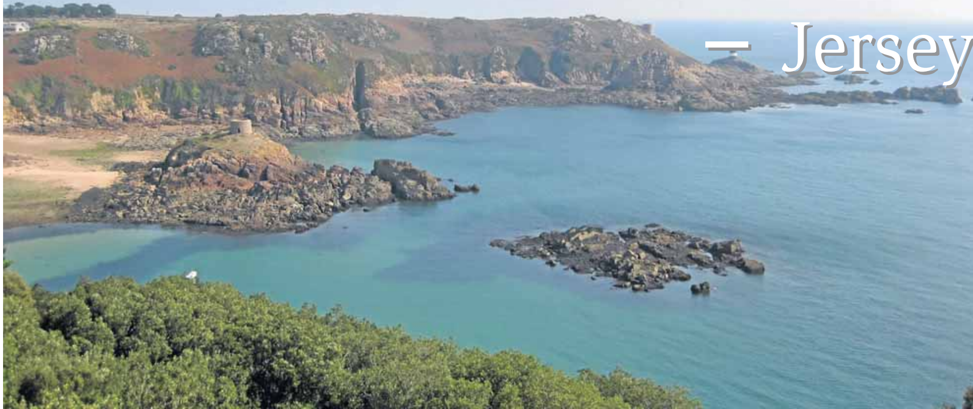
Klippen, malerische Landschaften und eine intakte Natur: Auf Jersey trifft man aber auch eigenwillige, aber ausgesprochen lebenswerte Menschen.